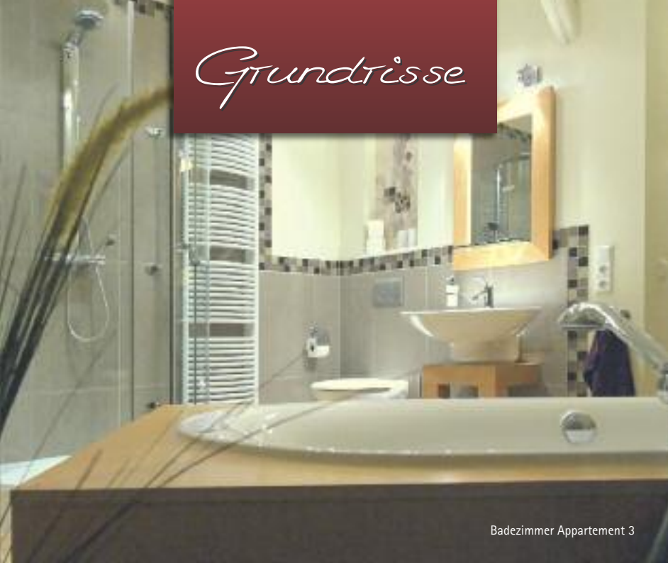
Badezimmer Appartement 3